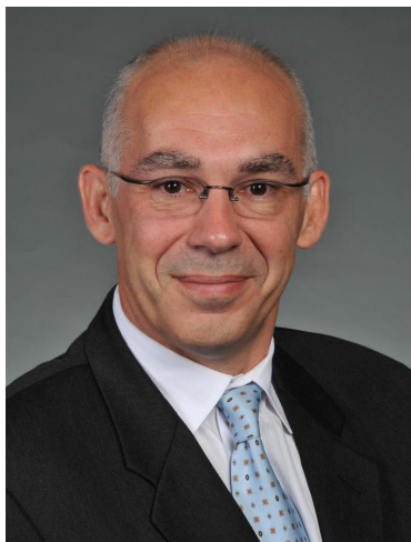
Председатель концерн «Шелл» в России